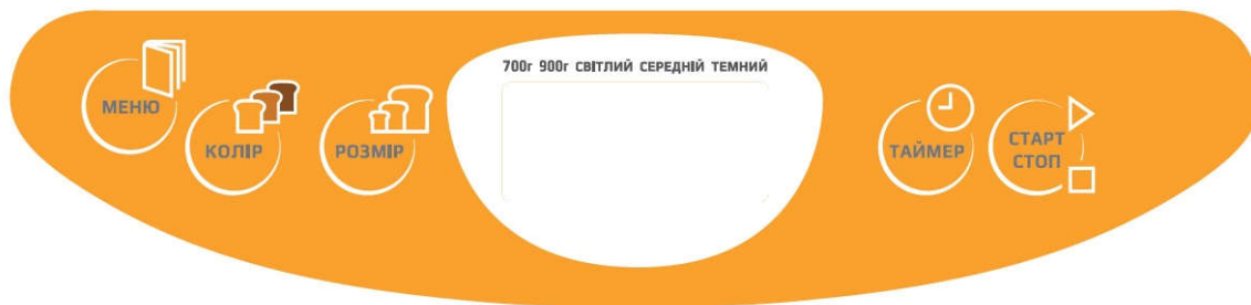
Панель управління ВМ-6190