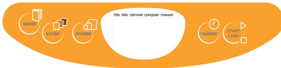
Панель управління моделі ВМ-6190