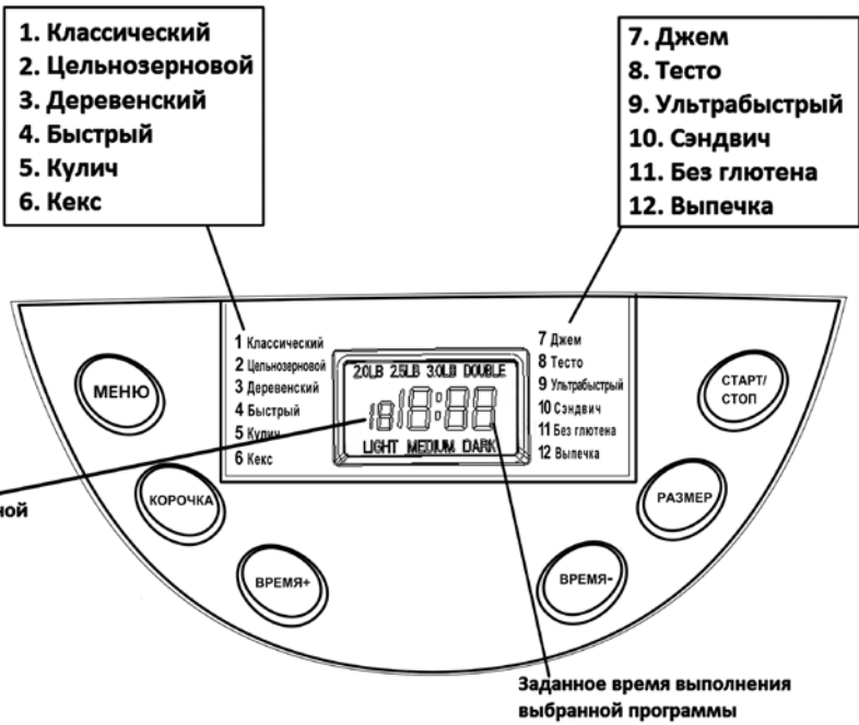
Рис.2. Панель управления