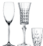
Бокалы, стаканы и рюмки