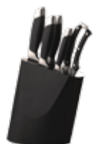
Наборы кухонных ножей