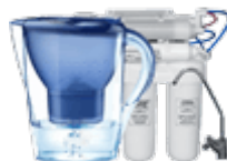
Фильтры для воды