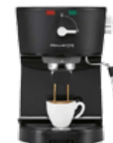
Кофеварки и кофемашины