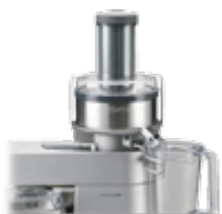
Аксессуары к кухонным комбайнам и блендерам